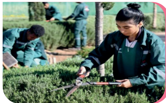
Jeunes et femmes coopérant au sein des coopératives de services agricoles