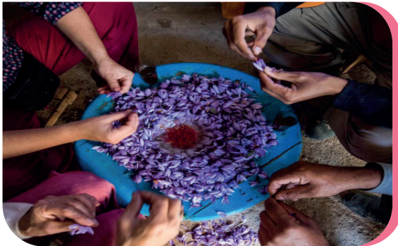
Femmes d'une coopérative produisant du safran