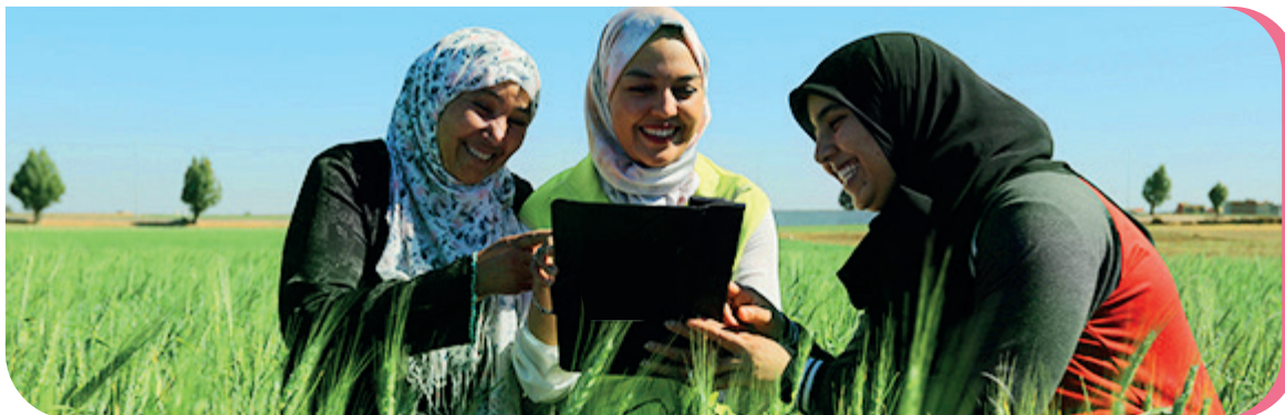
Femme cheffe d'exploitation agricole