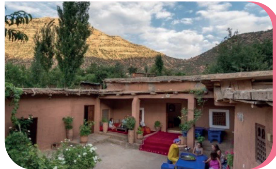
Femmes d'une coopérative agro-touristique