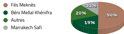
Les principales régions de production d'oignons, 2017