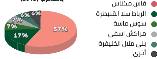
أهم الجهات المنتجة للخوخ و النكتارين بالمغرب (2019)